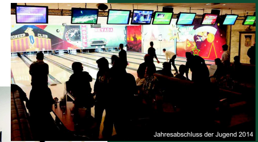
Jahresabschluss der Jugend 2014

* Im ersten Jahr bezahlt Ihr nur die Hälfte des Jahres-beitrags eurer Alterstufe